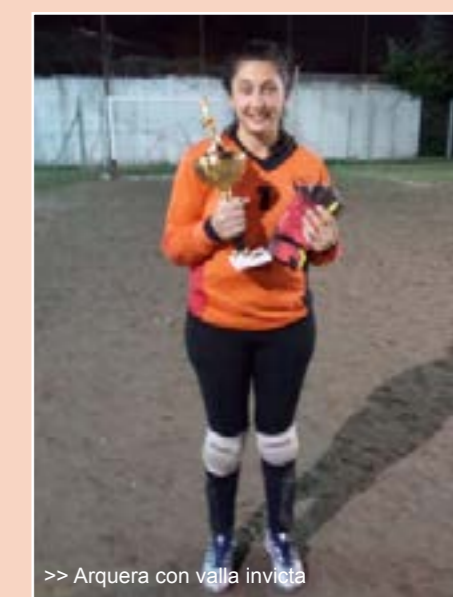
>> Arquera con valla invicta