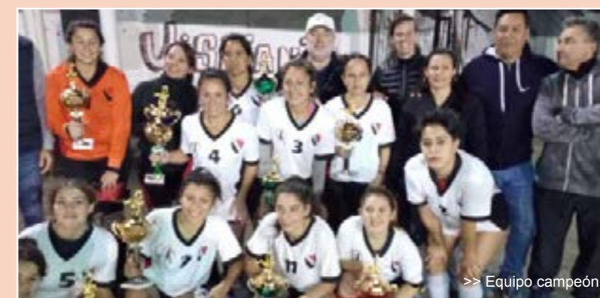
>> Equipo campeón