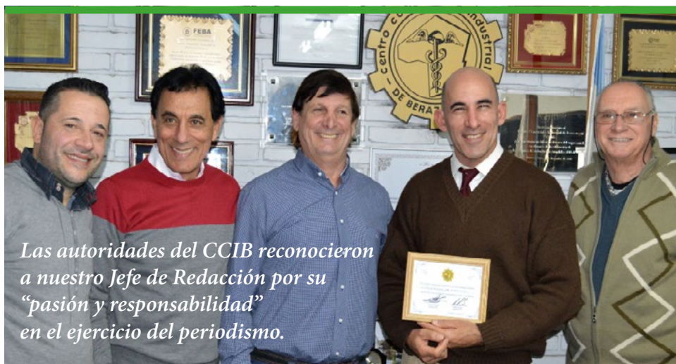
Las autoridades del CCIB reconocieron a nuestro Jefe de Redacción por su "pasión y responsabilidad" en el ejercicio del periodismo.