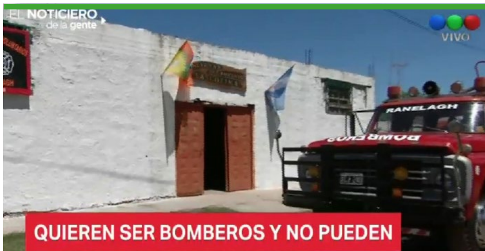
QUIEREN SER BOMBEROS Y NO PUEDEN

El problema local llegó a Telefé, Telenoche y otros medios nacionales.