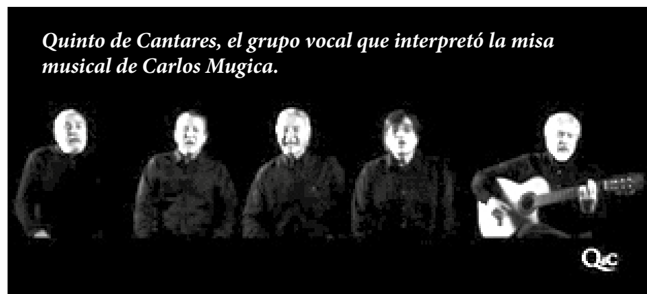
Quinto de Cantares, el grupo vocal que interpretó la misa musical de Carlos Mugica.

Hasta que este año, dos sobrevivientes del mítico Grupo Vocal