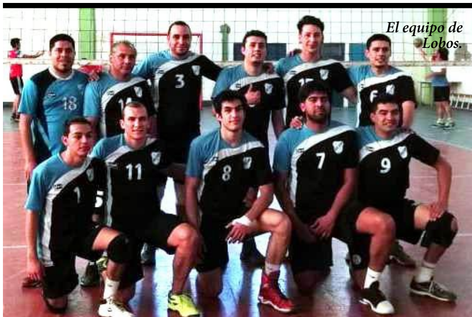
El equipo de Lobos.