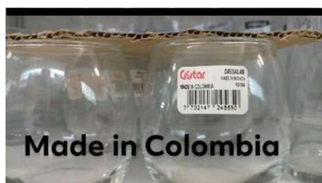
Made in Colombia