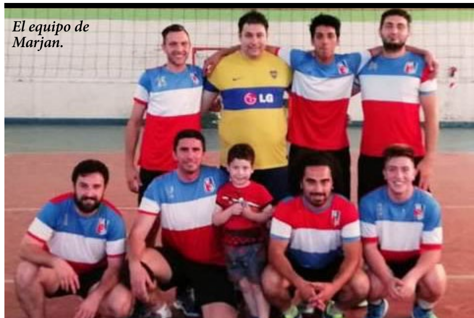
El equipo de Marjan.

Las fotos ilustran a los primeros semi finalista del Torneo clausura de la Asociación de Voley Capital Nacional del Vidrio.