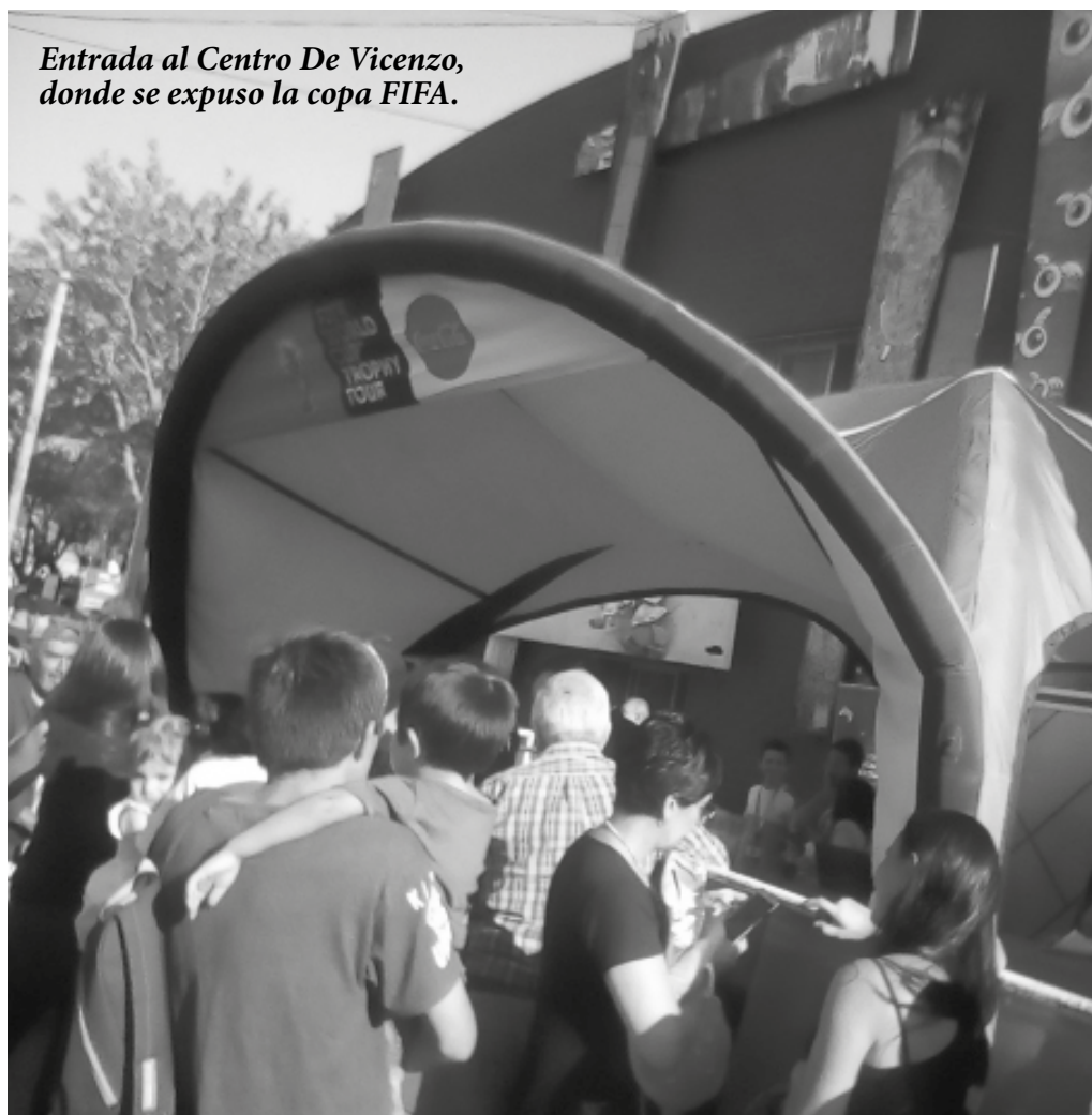
Entrada al Centro De Vicenzo, donde se expuso la copa FIFA.