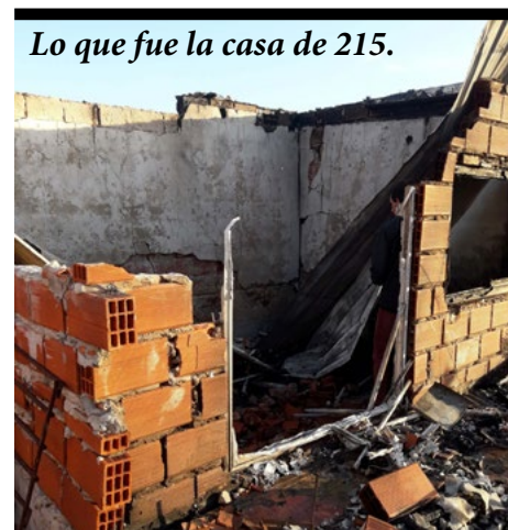
Lo que fue la casa de 215.