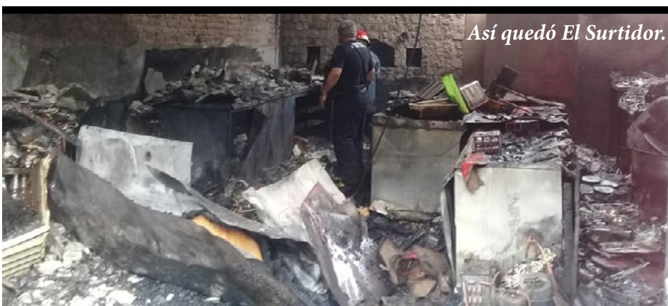
Así quedó El Surtidor.