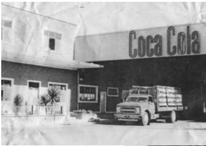
Embotelladora emblemática de Coca Cola