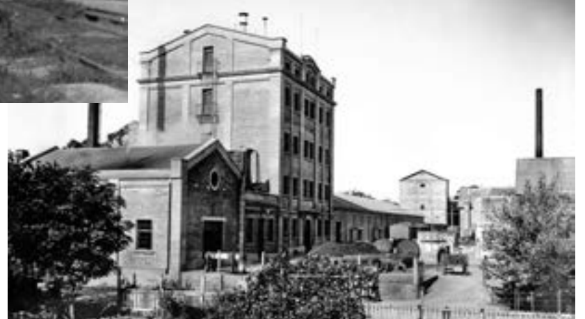
Vista de la Maltería Hudson

A.v. Rigolleau (14) N°3060 e/130 y 131 (1884) Berazategui Prov. Buenos Aires / Tel: 4256-4498 / 4216-1370