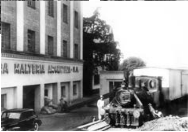
El empuje del distrito se dió en su actividad fabril