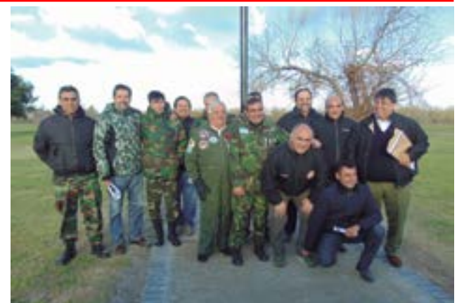
Inauguraron cementerio Malvinero