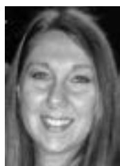
por Viviana Petrillo Grafóloga Oficial

En cambio un ambiente gráfico negativo es aquel en el que casi la totalidad de los aspectos y rasgos componentes presentan cierto desequilibrio, desorden o suciedad. Se asocia con la falta de control y equilibrio, visible a través de una notable desprolijidad, líneas superpuestas (invasión de zonas), ilegibilidad, suciedad, formas confusas o extrañas, retoques excesivos. El ambiente gráfico negativo nos habla de inconstancia, desorganización, falta de claridad en ideas y pensamientos.