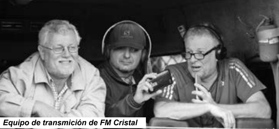
Equipo de transmisión de FM Cristal