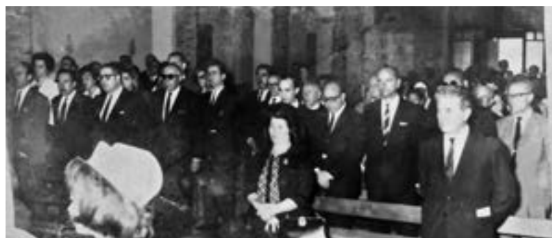
Tedeum del 4° Aniversario de la Autonomía

“ Adherimos a un nuevo Aniversario de esta pujante ciudad”