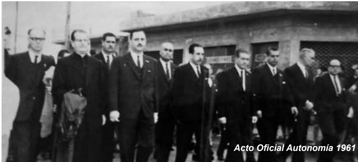
Acto Oficial Autonomía 1961