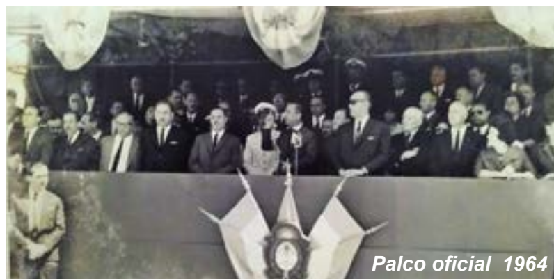
Palco oficial 1964