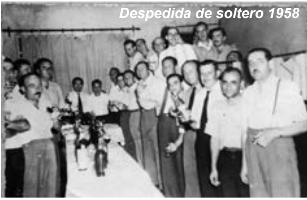
Despedida de soltero 1958