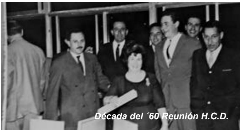
Década del '60 Reunión H.C.D.

▶ AFILIACIONES Tel. 4226-0167 / 0800-666-3700