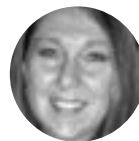
por Viviana Petrillo

El interés en la carrera de grafología podría nacer en personas curiosas, observadoras, analíticas, en quienes cada detalle tiene un porqué, en los que aman investigar, leer, los que se sienten atraídos hacia la psicología y por supuesto, hacia el análisis de la escritura.