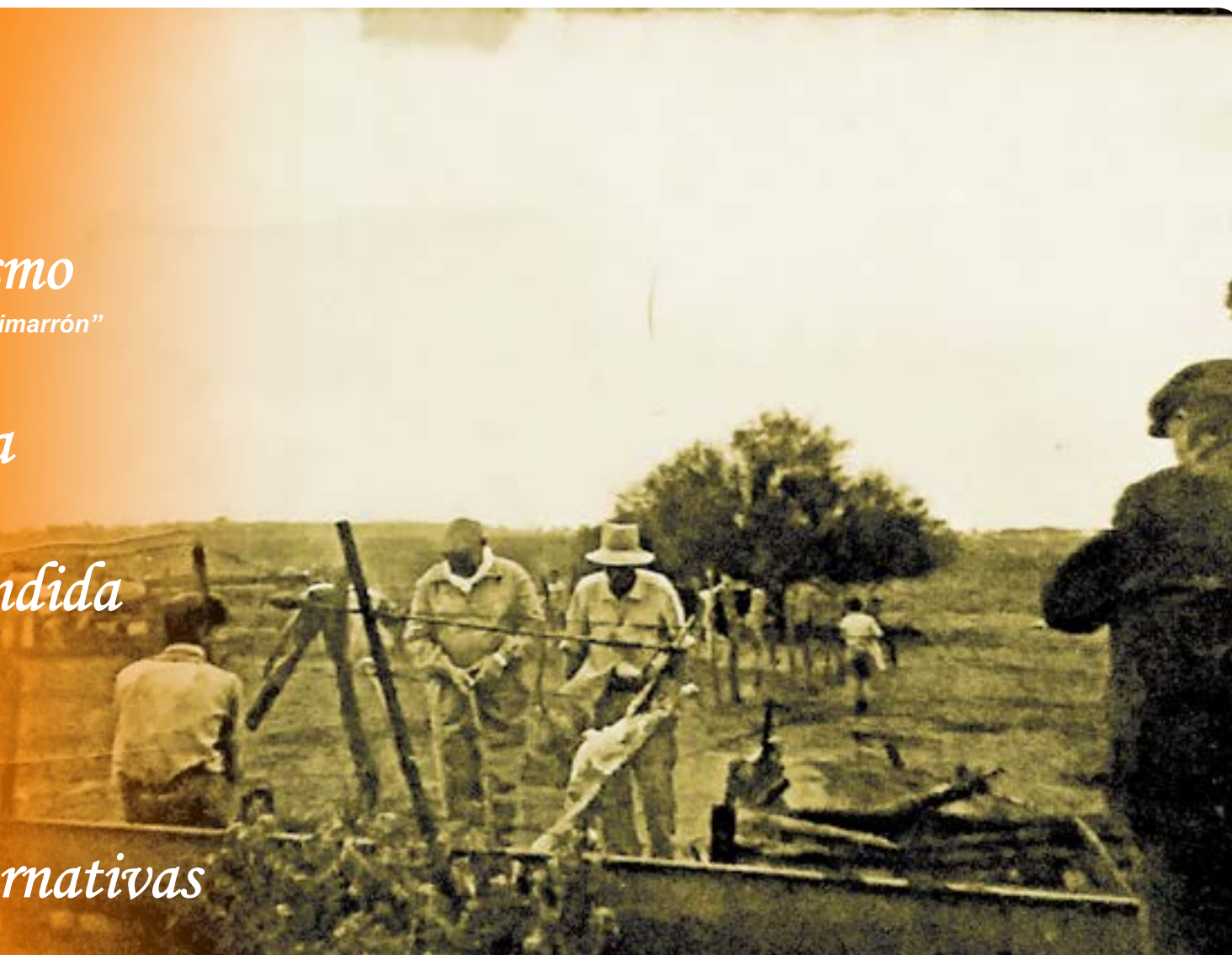
Año 36. Campo de Bassaber, Av 14 hacia el Norte