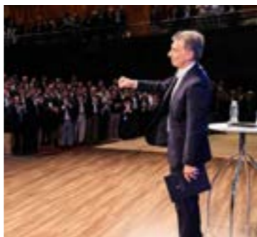
El discurso se dio un día después de que, a través de redes sociales, difundieran un documento con los "logros" de la gestión.

"Escucho que algunos dicen que esto se arregla creciendo, ¿quién no quiere crecer, quién no quiere crecer?!"