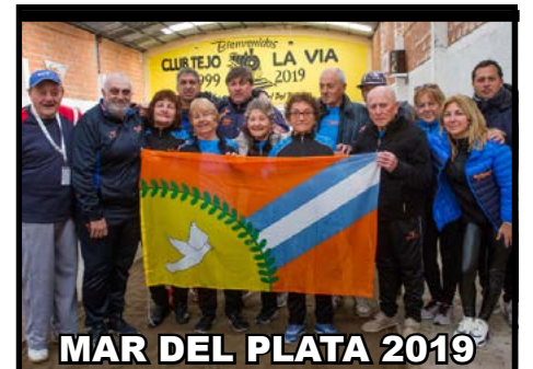
MAR DEL PLATA 2019