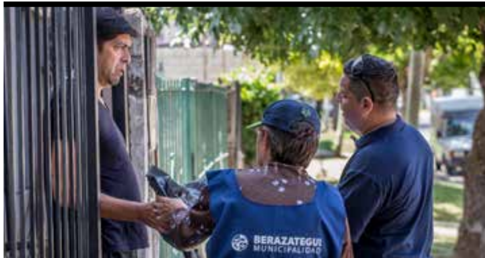
Agentes de Salud pasaron casa por casa en algunos barrios para informar medidas de prevención que eviten la reproducción del mosquito transmisor.