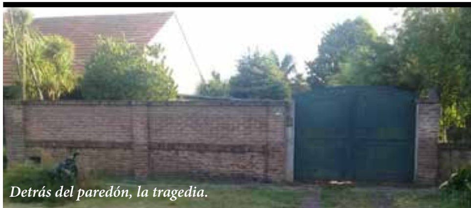
Detrás del paredón, la tragedia.