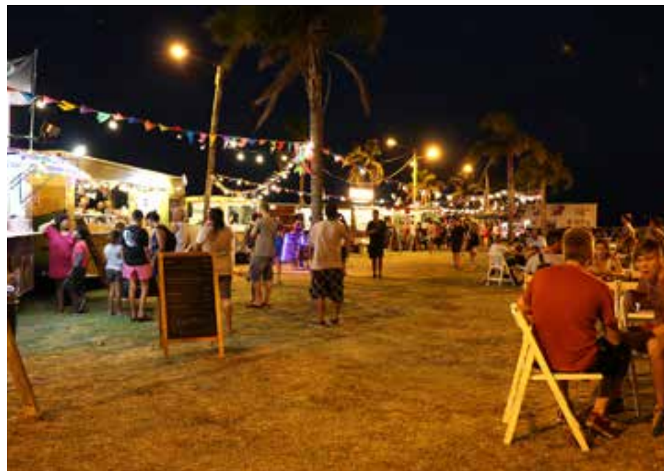
Estará todo el verano.

A través de la Dirección general de Desarrollo comercial, perteneciente a la Secretaría de Trabajo del Municipio, se informa a continuación las fechas y sitios donde los vecinos