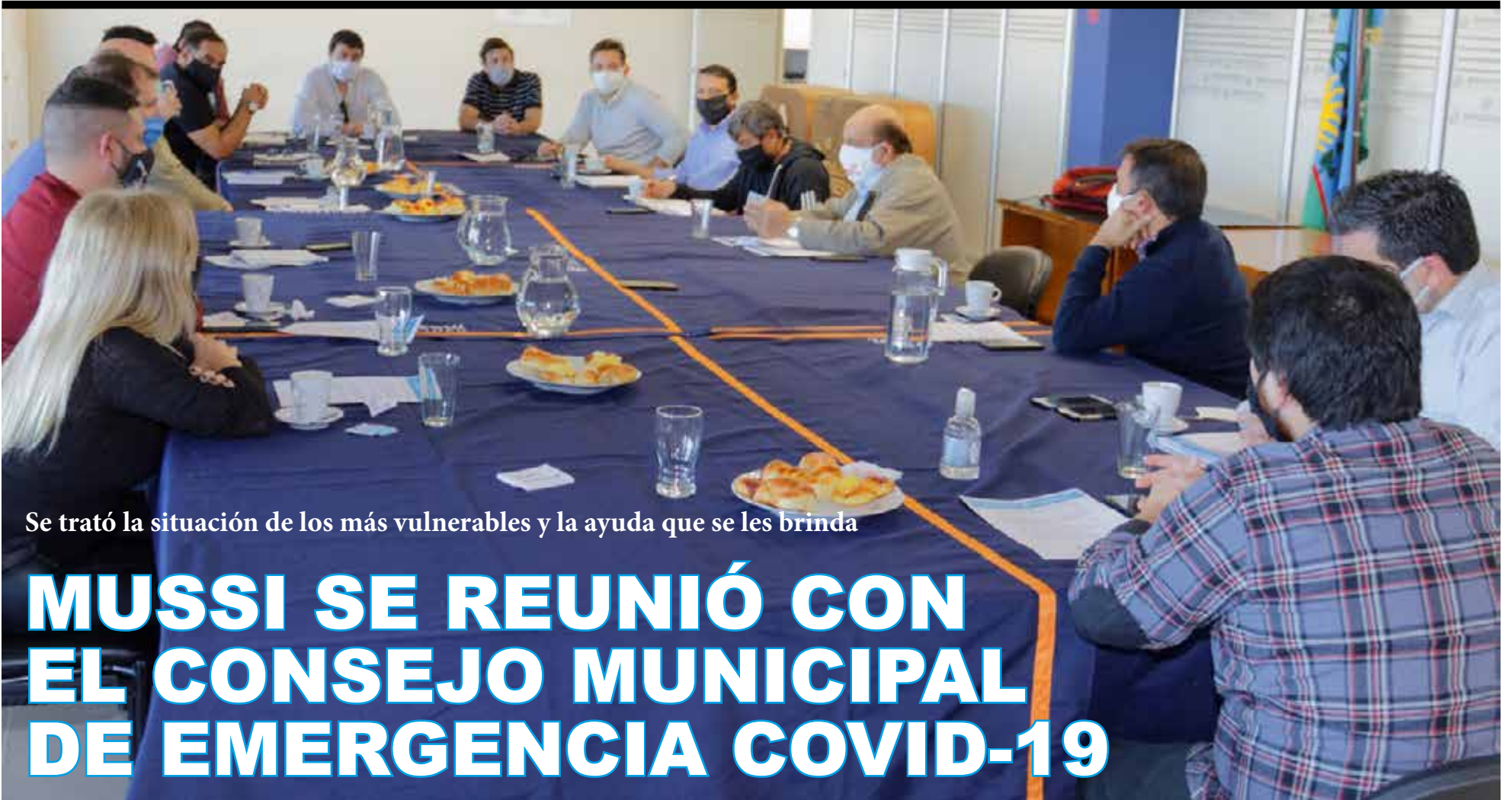
Se trató la situación de los más vulnerables y la ayuda que se les brinda