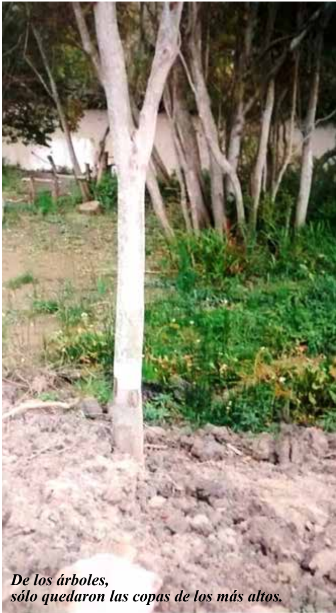
De los árboles, sólo quedaron las copas de los más altos.

Ante toda esa avanzada resistieron los ambientalistas y los vecinos que empezaban a inundarse con cada emprendimiento que elevaba los suelos y levantaba barreras contenedoras de agua que, al rebotar, caen sobre los más humildes.