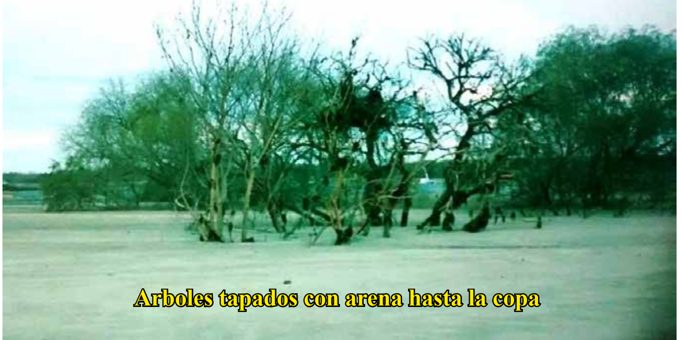
Arboles tapados con arena hasta la copa