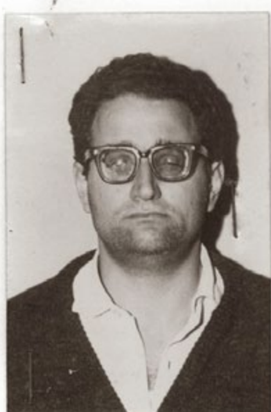
Fotos de su prontuario en la Policía Federal Argentina.