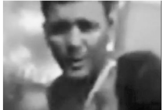
"Se te atiende, se te da todo y venís a robar acá, laburamos para ustedes. Nos afanan a nosotros que les vivimos salvando la vida", le dijo una trabajadora del Iriarte que lo filmó al momento de la aprehensión

En el Hospital de Quilmes era atendido una persona con diversas lesiones físicas. Tras culminar con las curaciones, el malviviente se retiró