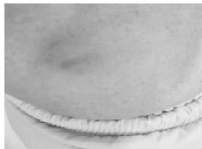
Moretones y contusiones sufrió una de las médicas del Oller de Solano

del lugar, pero no dudó en robar a un médico del nosocomio quilmeño en su retirada.