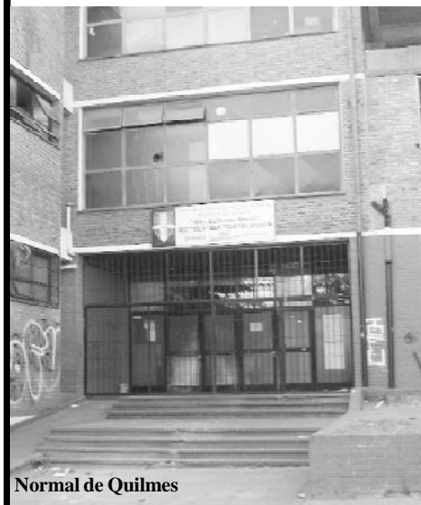
Normal de Quilmes

El 1 de marzo comienzan las clases a través de un sistema de presencialidad que exhibe matices según la escuela. Las variables son el espacio físico, el número de estudiantes por curso y los recursos disponibles.