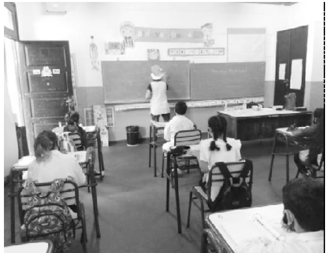
La Escuela N°2 de Quilmes fue una de las pocas escuelas públicas que dictaron clases presenciales de 3 horas y media.

A pesar de que las resoluciones del Consejo Federal de Educación y el último protocolo provincial abogan por las "actividades no presenciales", los docentes consultados de nivel medio advierten que este año deben realizar clases por zoom desde la escuela. Esta diferencia nominal no es antojadiza, sino que responde a que no pueden garantizar