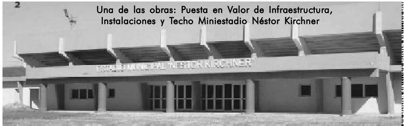
Una de las obras: Puesta en Valor de Infraestructura, Instalaciones y Techo Miniestadio Néstor Kirchner

De este monto de casi 1.900 millones de pesos, alrededor de 1300 se van para sueltos de empleados, funcionarios y docentes de la alta casa de estudios quilmeña.