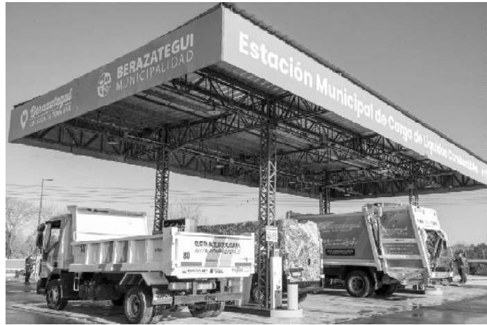
no, no solo implica un ahorro en dinero, sino que agiliza mucho los tiempos de trabajo, ya que no

Por su parte, el subsecretario de Coordinación de Automotores, Federico Pereyra, remarcó que "la Estación está habilitada por la Subsecretaría de Energía del Gobierno nacional, con todas las medidas y protocolos de seguridad que exige una estación de servicio. De esta forma conseguimos articular con YPF". Y agregó: "Contar con esto, no solo implica un ahorro en dinero, sino que agiliza mucho los tiempos de trabajo, ya que no tendremos que cargar más en otros lugares".