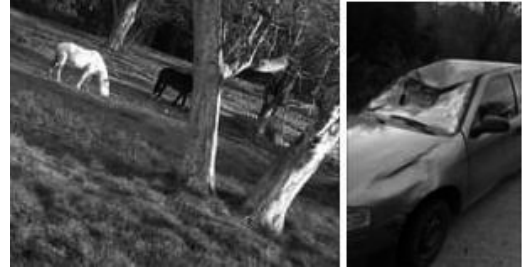
Imagenes de un caballo silvestre y un accidente de un auto.