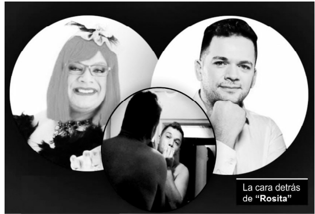
La cara detrás de "Rosita"

Por otro lado señalaron que el triunfo electoral les "interpela no sólo a continuar el trabajo que se viene realizando sino a redoblar los esfuerzos para seguir construyendo con otros actores y organizaciones los objetivos en pos del crecimiento universitario y el desarrollo de sus estudiantes".