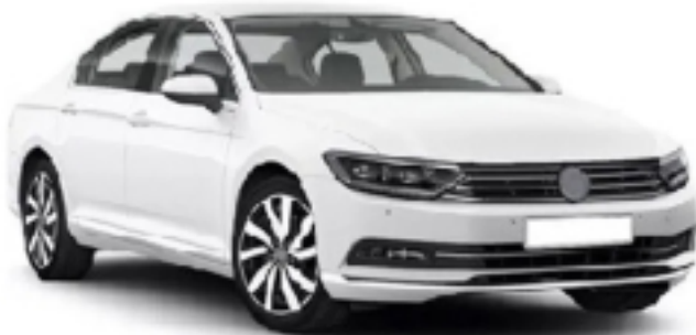
Av. Mitre N° 983