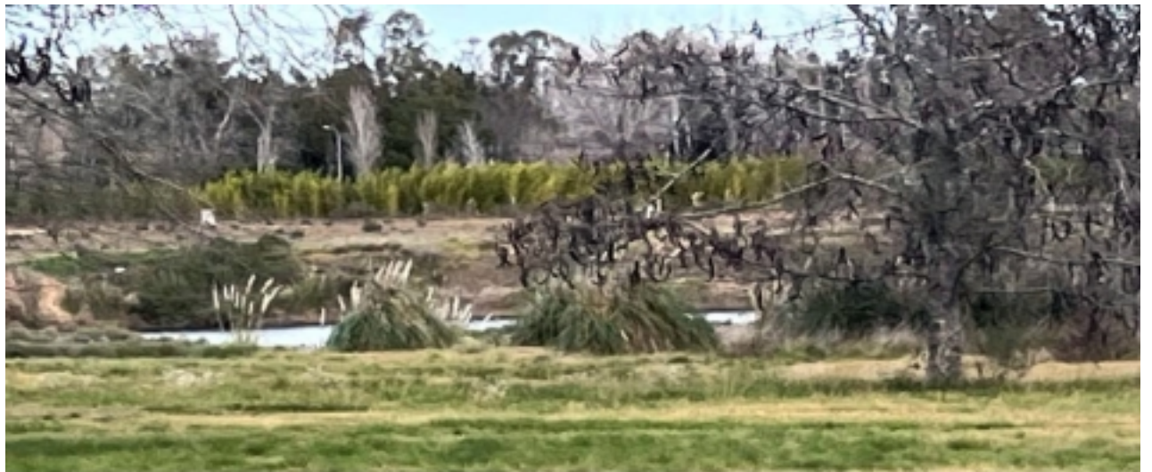
Lo que iba a ser la 'laguna' de Hudson Park, hoy es el depósito de los excrementos que vuelcan los camiones atmosféricos...

Muchos interesados en las tierras «caen como moscas» después de la publicación en el diario 'Clarín' sobre que se habrían arreglado los problemas, cuando la verdad es que hay un montón de estafados que judicializaron el tema y esperan la resolución de la Corte provincial, pero mientras tanto, ahora arrancaron con un nuevo loteo en una fracción de tierra desprovista de legitimidad y legalidad en sus papeles, ya que inclusive algunos lotes fueron vendidos dos y hasta tres veces.