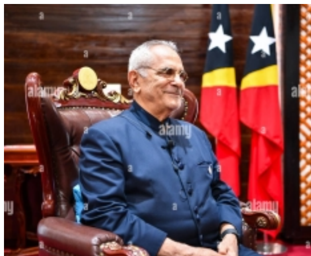
José Ramos Horta, Presidente de Timor Leste

naciones para su crecimiento y progreso, y mi deber como representante de Timor, fue exponer ante los diputados argentinos para que conozcan mas de nuestro pequeño gran país, para el viaje que en diciembre seguramente hará nuestro jefe de Estado» apuntó el cónsul.