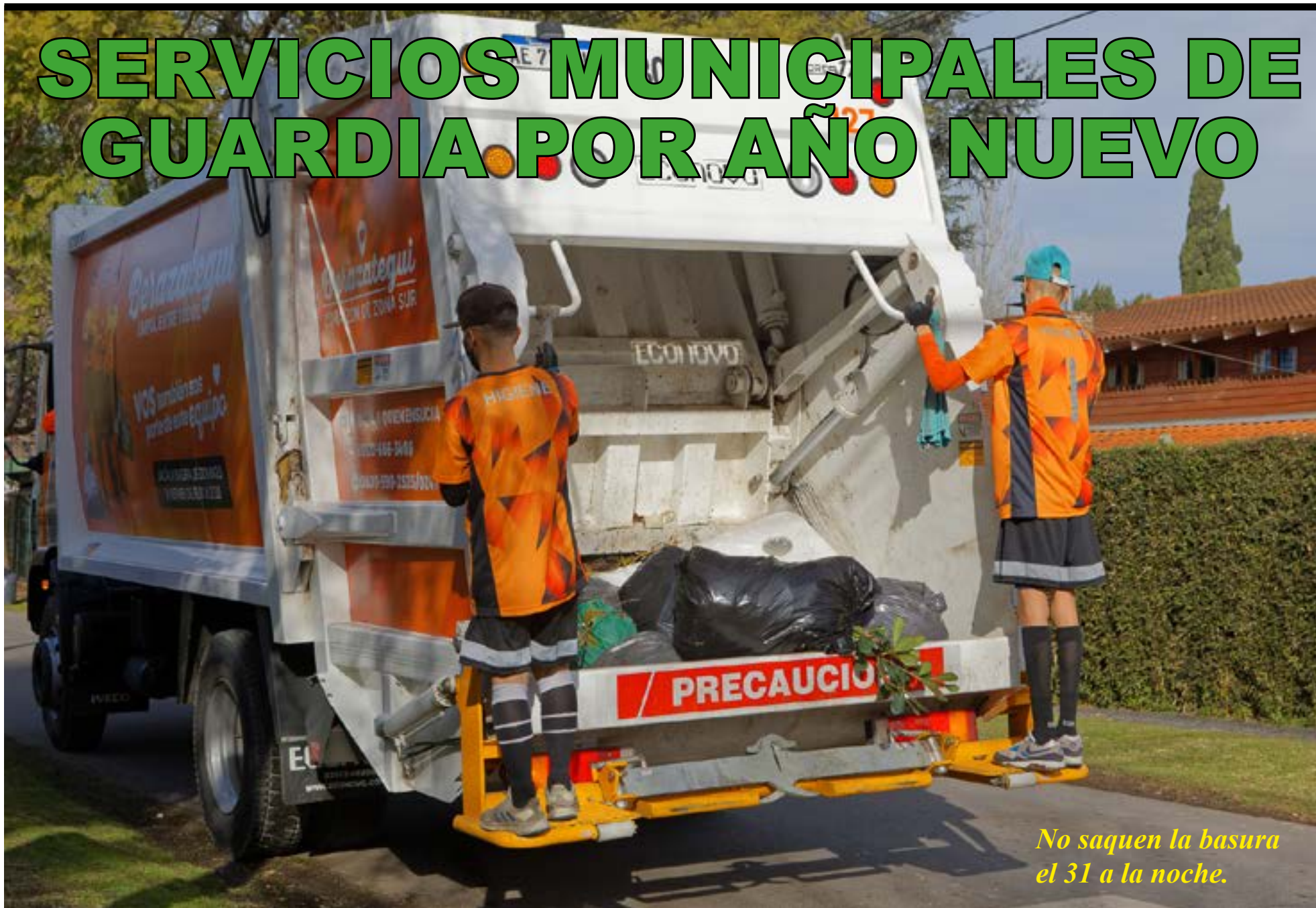
No saquen la basura el 31 a la noche.

La Municipalidad informará cómo funcionarán las dependencias el lunes 1 de enero, feriado por Año Nuevo. En primer lugar, se solicita no sacar sus residuos domiciliarios el domingo 31 de diciembre y hacerlo el lunes, en el horario habitual de recolección, de 19 a 21.