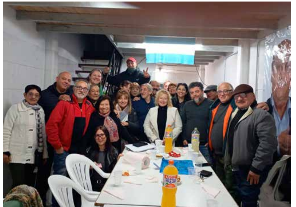
La Unidad Básica invita "a los compañeros y compañeras a participar todos los martes a las 19 horas de nuestras reuniones"