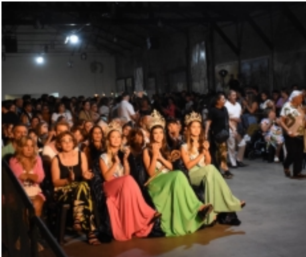
El mismo se llevará a cabo el próximo y será

El pueblo de Ayacucho se prepara para un evento que marcará el inicio de las Bodas de Oro de la emblemática Fiesta del Ternero y Día de la Yerra .